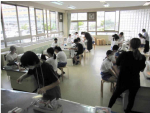
ミシンボランティアの方々

6年生が家庭科の時間に、修学旅行で使うナップザック製作をしました。ミシンボランティアの方々を手伝っていただき、古着に手を加え、ナップザックに作り替えることができました。9月3日(日)、4日(月)、リメイクしたナップザックを持って修学旅行に行ってきました。