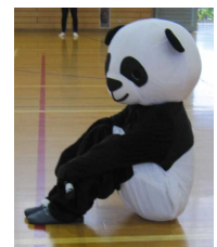
見送りに来たパンダくん